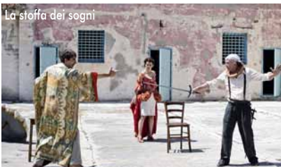
La stoffa dei sogni

Eine Fähre zu einer abgelegenen Insel, auf der sich ein Hochsicherheitsgefängnis befindet, ist gekentert. Unter den Geretteten befindet sich neben den verurteilten Häftlingen auch eine Theatertruppe. Aber wer ist wer? Wie das durch eine Shakespeare-Aufführung geklärt werden soll, zeigt der leichtgängig inszenierte Sommerfilm LA STOFFA DEI SOGNI . Wie man eine scheinbar alltägliche Geschichte aufregend anders erzählt, dafür ist PER AMOR VOSTRO ein gelungenes Beispiel. Darin entflieht eine Mutter und Ehefrau aus Neapel einer monotonen Realität in eine andere Welt.