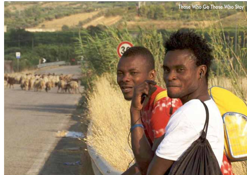
Those Who Go Those Who Stay