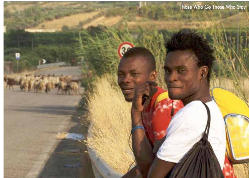
Those Who Go Those Who Stay